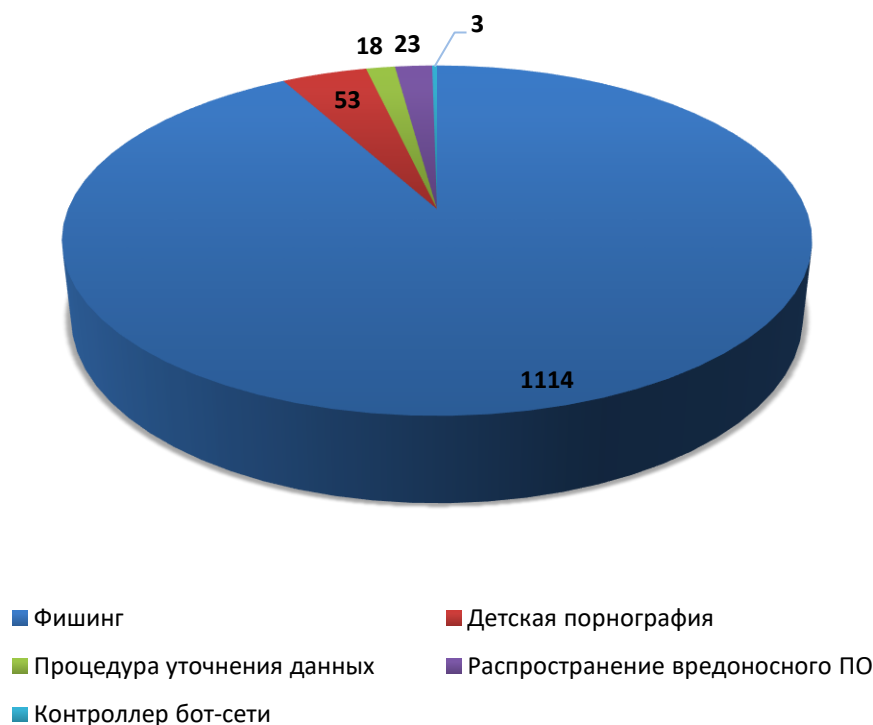
Рис.2 Распределение доменов по видам вредоносной активности (октябрь 2020)

За отчетный период по обращениям компетентных организаций были сняты с делегирования 1066 доменных имен. Для 4 доменных имен снятие делегирования не потребовалось вследствие оперативного устранения причин блокировки администратором домена или своевременного подтверждения администратором домена идентификационных данных. В 71 случае, снятия делегирования не потребовалось, так как ресурс был заблокирован хостинг-провайдером. В 19 случаях, регистратором не усмотрено достаточно оснований для снятия делегирования или инициирования проверки администратора. На момент подготовки отчета, 51 обращение находилось в статусе обработки.