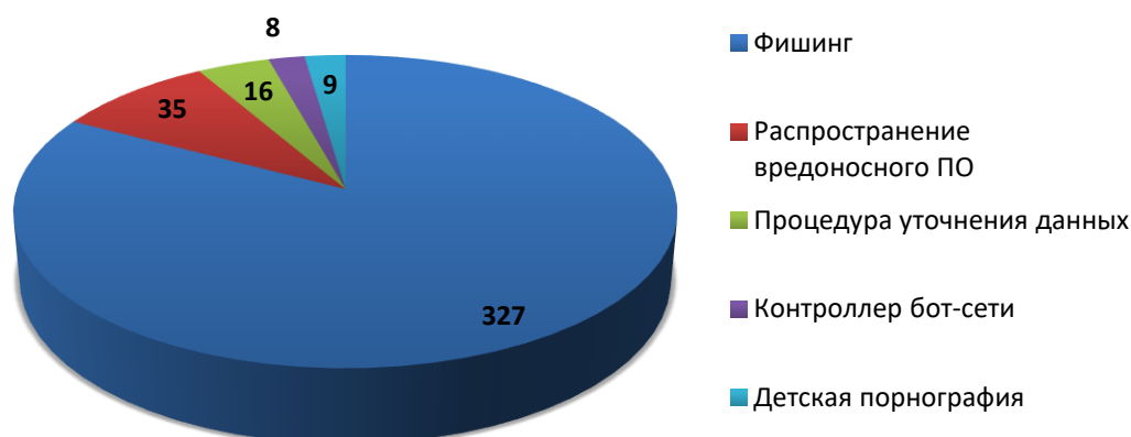
Рис.1 Распределение доменов по видам вредоносной активности (февраль 2020)

За отчетный период по обращениям компетентных организаций были сняты с делегирования 323 доменных имени. Для 8 доменных имен снятие делегирования не потребовалось вследствие оперативного устранения причин блокировки администратором домена или своевременного подтверждения администратором домена идентификационных данных. В 12 случаях, снятия делегирования не потребовалось, так как ресурс был заблокирован хостинг-провайдером. В 12 случаях, регистратором не усмотрено достаточно оснований для снятия делегирования или инициирования проверки администратора. На момент подготовки отчета, 40 обращений находились в статусе обработки.