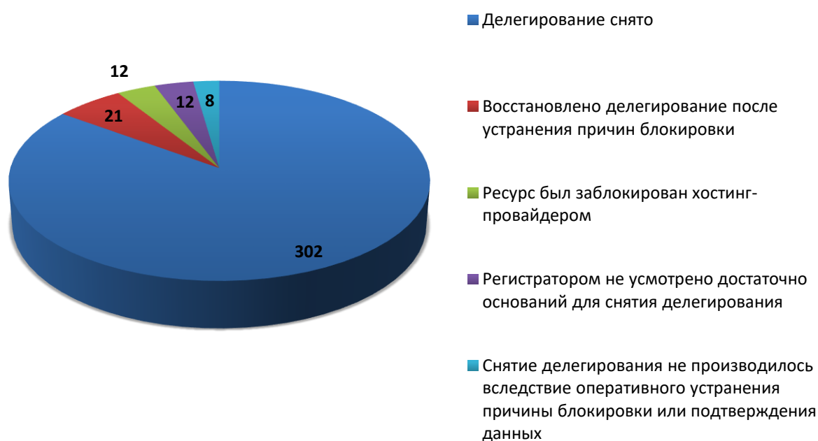
Рис.2 Итоги обработки обращений о снятии делегирования (февраль 2020)

За отчетный период по обращениям компетентных организаций были сняты с делегирования 323 доменных имени. Для 8 доменных имен снятие делегирования не потребовалось вследствие оперативного устранения причин блокировки администратором домена или своевременного подтверждения администратором домена идентификационных данных. В 12 случаях, снятия делегирования не потребовалось, так как ресурс был заблокирован хостинг-провайдером. В 12 случаях, регистратором не усмотрено достаточно оснований для снятия делегирования или инициирования проверки администратора. На момент подготовки отчета, 40 обращений находились в статусе обработки.